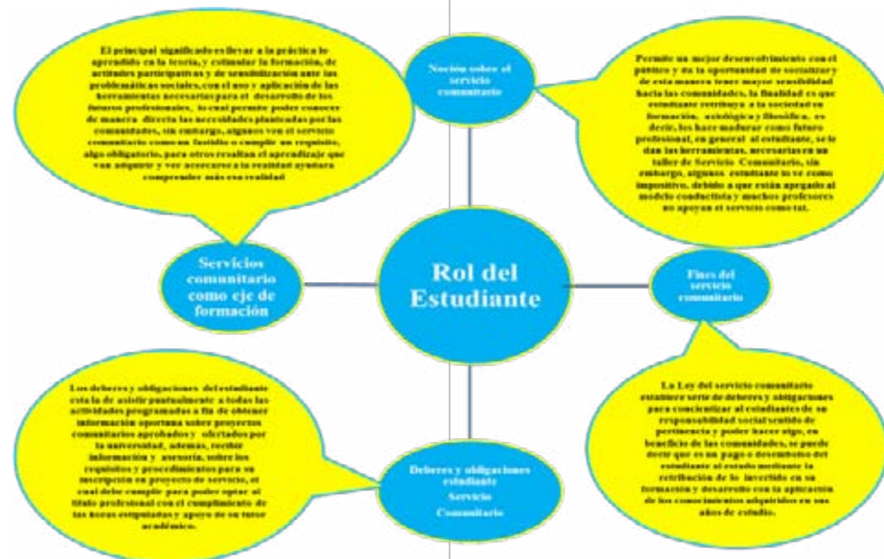
Figura 1. Estructura general de los informantes claves. Categoría: Rol del estudiante

La contrastación, es la etapa de la investigación que consiste en relacionar y contrastar sus resultados con aquellos estudios paralelos (Martínez, 2004), para ver cómo aparecen desde perspectivas diferentes o sobre marcos teóricos más amplios y explicar mejor lo que el estudio verdaderamente significa. Es, por consiguiente, también un proceso típicamente evaluativo, que tiende a reforzar la validez y la confiabilidad.